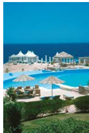
Viel Platz an den Pools