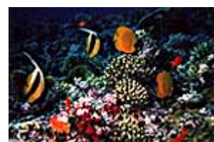
Farbenprächtige Riffe garantiert