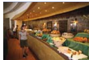
Eine der schönsten Anlagen am Roten Meer! Ausgezeichnete Küche

Live-Musik und Cabaret; beliebter Treffpunkt ist das Beduinenzelt am Strand. Das Hotel bietet einen kostenlosen Shuttle-Transfer zum benachbarten Strand von Abu Dabab. Faszinierend durch die Bauweise: Die Disco 'The Mine'.