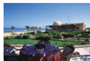
Modern und großzügig gestaltete Tauchbasis