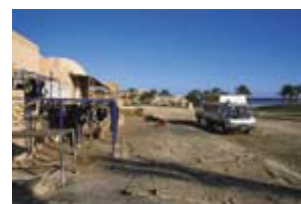
Im Taucherbus zu den Tauchplätzen