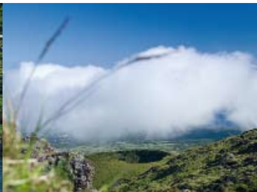
Ein grünes Hochland mit sanften Berghängen, unterbrochen von kleinen Vulkankegeln: Pico's Inneres ist ideal für Wanderer