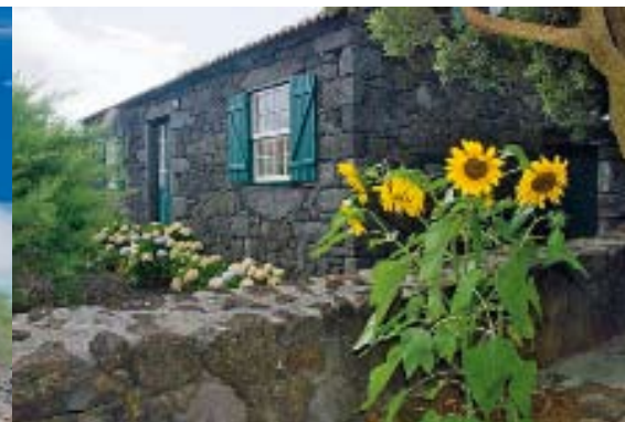
Alte Heimat: Im Inneren der Insel Pico trifft man immer wieder auf vereinzelte Gehöfte, umgeben von den dunklen Mauern aus Lavagestein