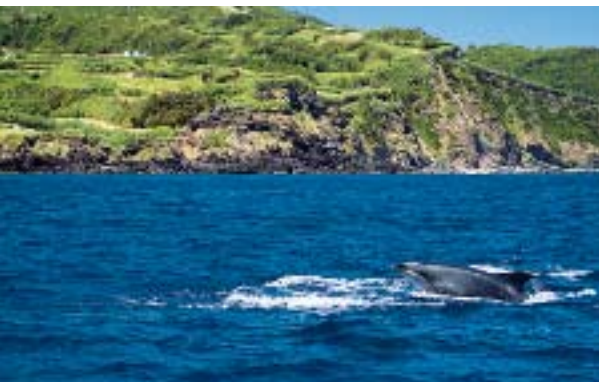
Häufige Begleiter der Boote: Von Juni bis Ende August ist auf den Azoren die beste Zeit für Delfin-Begegnungen – und das nicht nur vom Boot aus

Doch da mögen Wale, Delfine und Mobulas noch so sehr um Aufmerksamkeit buhlen – die zweitgrößte Insel der Azoren hat auf 42 Kilometern Länge so viele Naturschönheiten zu bieten, dass sich ein reiner Tauchurlaub von allein verbietet. Zumindest ein Tagesausflug im Leihwagen oder rustikaler auf dem Motorroller gehört zum Erlebnis Azoren dazu. Mit 2351 Metern Höhe >