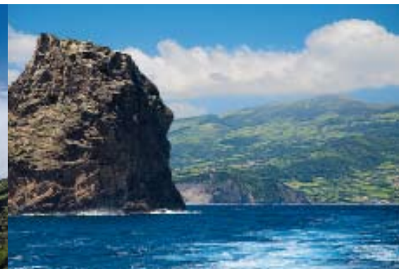
Es muss nicht immer Offshore-Tauchen sein: Auch küstennah gibt es Klippen und Riffe, die das Meeresleben wie ein Magnet anziehen