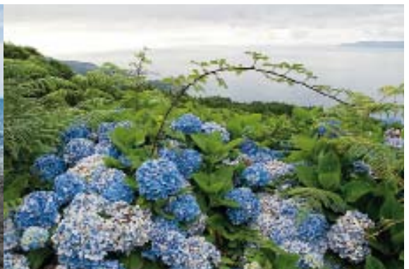
Wie geschaffen für das wechselhafte Klima: Kilometerlange Hortensienhecken verteilen monatelang babyblaue Farbtupfer über die Inseln im Atlantik