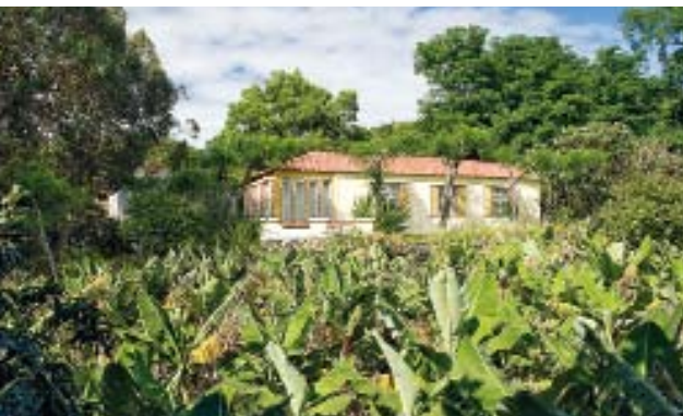
Auf Parzellen fruchtbaren Bodens gedeiht auf Pico ein legendärer Wein. Die Kulturlandschaft wurde sogar zum Weltkulturerbe erklärt

Seit sechs Jahren genießen die Weinanbaugebiete der Insel den Status als UNESCO Weltkulturerbe. Und ebenso knorrig wie die Weinreben sind viele der Menschen auf Pico, die den rauen Bedingungen der Wintermonate Jahr für Jahr trotzen – und ihr Glück nicht in den USA oder in Kanada suchten wie so viele ihrer Landsleute. Regenperioden und kühle Nächte gibt es im Gegensatz zu weiter südlich gelegenen Inseln wie Madeira oder den Kanaren auch in den Sommermonaten. Dafür ging der Massentourismus an den Azoren vorbei. Auch heute scheint die Insel trotz steigender Tourismus-Einkünfte noch nicht aus ihrem Dornröschenschlaf erwacht zu sein.