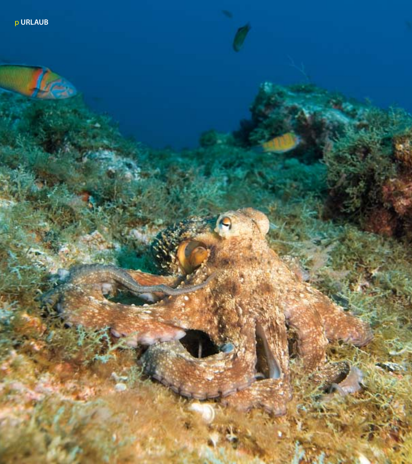
Es ist nicht alles blau, was glänzt auf den Azoren-Inseln: Auch die Riffe sind dicht bevölkert – unter anderem mit stattlichen Kraken wie diesem