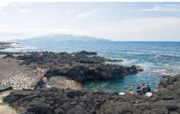
Schwarze Lavaküsten mit eher begrenztem Gemütlichkeitsfaktor: Wer auf malerische Sandstrände Wert legt, ist auf den Azoren fehl am Platz