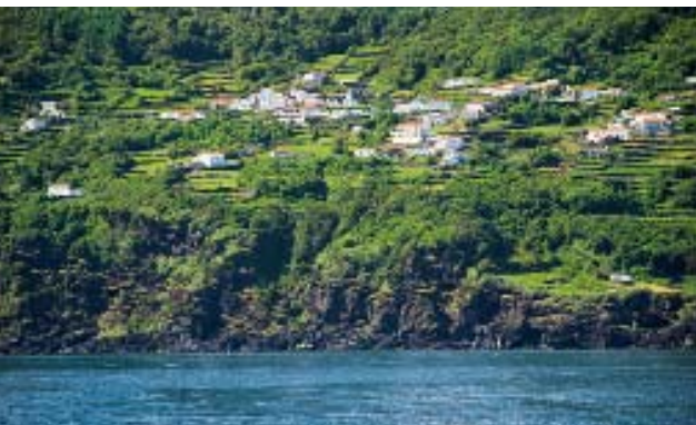
Tiefschwarze Klippen, grüne Hänge, niedrige Mauern aus Lavagestein: ein typisches Bild für die Vulkan-Insel Pico

Die Rückfahrt wird von einer plötzlichen Wasserfontäne ausgebremst. Bläst da ein Wal – so nah am Boot? Mitnichten, das war ein klassischer Bauchplatscher! Ein Knäuel aus mehr als zehn Tümmlern schießt in Fahrtrichtung heran, und kurz darauf schießen sie schon vor dem Bug hin und her und wechseln so munter die Seiten, als gelte es, uns Fotografen in den Wahnsinn zu treiben. Ruckzuck stecken die Füße in den Flossen und schon gleiten wir