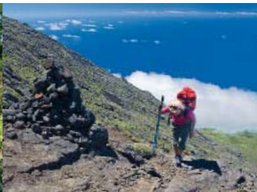
Aufstieg für Wanderer mit ausreichend Kondition: Der imposante Vulkan Pico ist mit 2351 Metern der höchste Berg der Azoren und Portugals