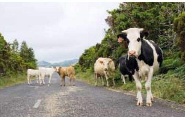
Fast wie im Allgäu: Das wechselhafte, nicht zu heiße Klima der Azoren bietet gute Lebensbedingungen für das Fleckenvieh – besonders auf São Jorge