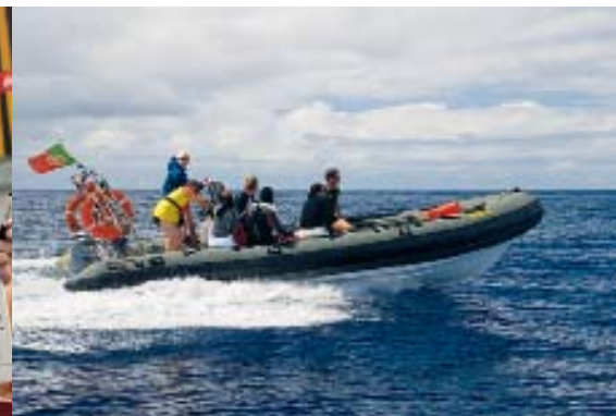
Nichts für Warmduscher: Der lange Aufenthalt auf den kleinen, schnellen Tauchbooten ist für viele eine Herausforderung