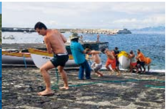
Selektiver Fang: Die Fischer der Azoren gehen mit traditionellen Mitteln auf »Beutezug« – mit kleinen Booten und mit Ruten, nicht mit Grundnetzen