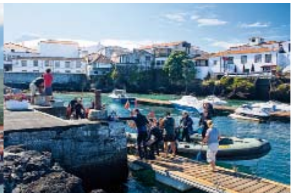
Lade-Tätigkeiten: Vorbereitung einer Tauchausfahrt. Auf der Insel Pico sind Schlauchboote das Taucher-Beförderungsmittel Nummer eins