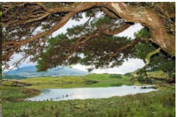
Fast ein wenig wie in Schottland: Die Seen im grünen Inselinneren auf Pico könnten auch in einer echten Highland-Landschaft liegen