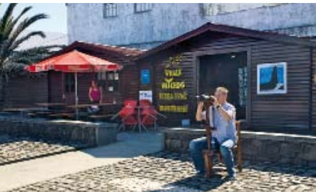
Tauchen, Whale Watching, Delfinschwimmen, spezielle Workshops: Pico Sport ist mehr als »nur« eine klassische Tauchbasis

Dennoch sind die Reviere um Pico herum kein Streichelzoo. Wie überall in der Natur gilt: Alles kann, nichts muss. An einem Tag erlebt man Tauchgänge, die nicht spektakulärer sind als durchschnittliche Abstiege im