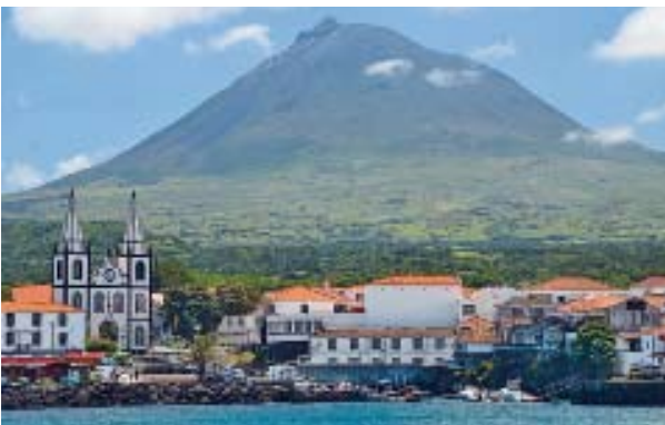
Fährhafen zur greifbar nah liegenden Nachbar-Insel Faial und Heimat der Basis Pico Sport: Das Städtchen Madalena im äußersten Westen der Insel Pico

Seinen legendären Ruf unter Wildlife-Fans verdankt der Archipel allerdings in erster Linie seinem enormen Reichtum an Meeressäugern: Beinahe 40 Wal- und Delfin-Arten wurden um die Azoren gesichtet, wobei die Gewässer um die Insel Pico mit ihrem steil abfallenden Küstenprofil grundsätzlich die besten Sichtungen versprechen. Gemeine Delfine, Fleckendelfine, Tümmeler und Pottwale werden in der kurzen Hauptsaison von Juli bis September beinahe täglich beobachtet, und zwar nicht selten wenige hundert Meter vor der rau- ➤