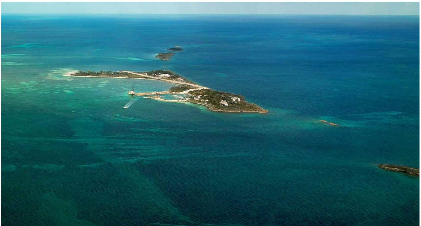
Landebahn im Meer...die Insel Walkers Cay. In der Bucht zeigen sich regelmässig Haie im Flachwasser

Grand Cay ist ein Eiland, das absolut nichts mit den Vorstellungen gängiger Bahamas-Werbung gemein hat. Übergewichtige Leute, einfache Holzhäuser, die einzige Strasse ist auch Flaniermeile und Rennstrecke für die vielen Elektrowägelchen. Richtige Autos gibt es so gut wie nicht. Ein kleiner Supermarkt, zwei unscheinbare Bäckereien, eine Nachtbar mit höllischer Discomusik, zwei düstere Spielunken und ein Gasthaus bereichern das Insel-