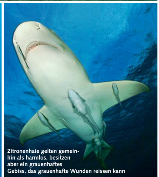
Zitronenhaie gelten gemeinhin als harmlos, besitzen aber ein grauenhaftes Gebiss, das grauenhafte Wunden reissen kann