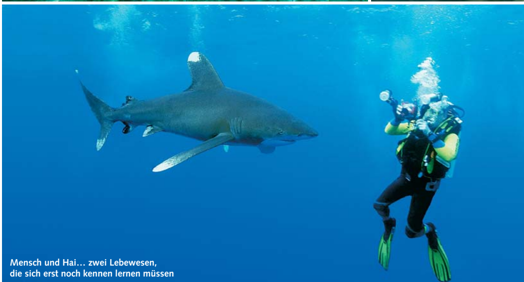
Mensch und Hai... zwei Lebewesen, die sich erst noch kennen lernen müssen